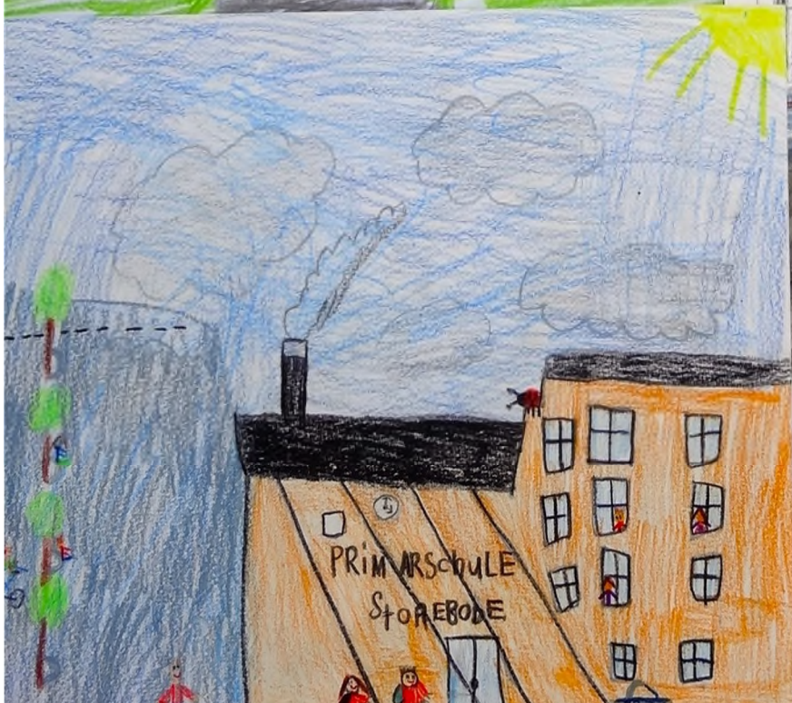
Zeichnungen von Schülerinnen und Schüler aus dem Kindergarten und der 1./2. Klassen der einzelnen Schulhäuser (2018)